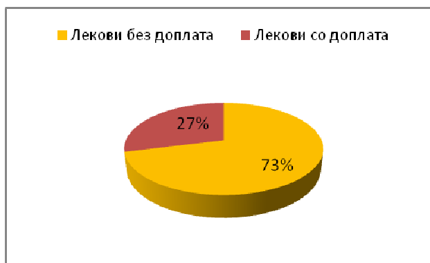
График 1. Споредба на референтните цени на лековите по генерики без и со доплата - 2012 година

Сумарно, од 2009 година кога бројката на лекови по генерики без доплата била 20%, во 2012 година е 73%, односно за периодот 2009-2012 година се бележи раст од 53% на бројот на лекови без доплата. Постои тенденција овој број да се зголемува и понатаму, со што ќе се намалува бројот на лекови со доплата.