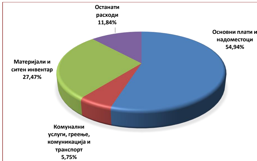
Графички приказ на структурата на реализирани расходи на ЈЗУ во период 01.01-31.01.2020 година