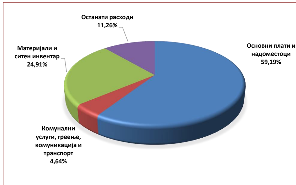
Графички приказ на структурата на реализирани расходи на ЈЗУ во период 01.01-28.02.2021 година