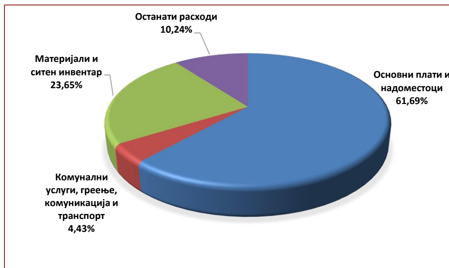
Графички приказ на структурата на реализирани расходи на ЈЗУ во период 01.01-31.01.2021 година