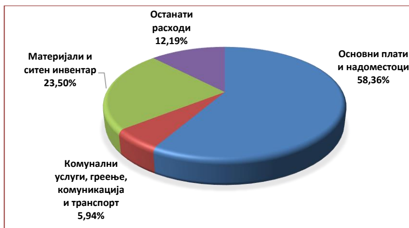
Графички приказ на структурата на реализирани расходи на ЈЗУ во период 01.01-28.02.2022 година