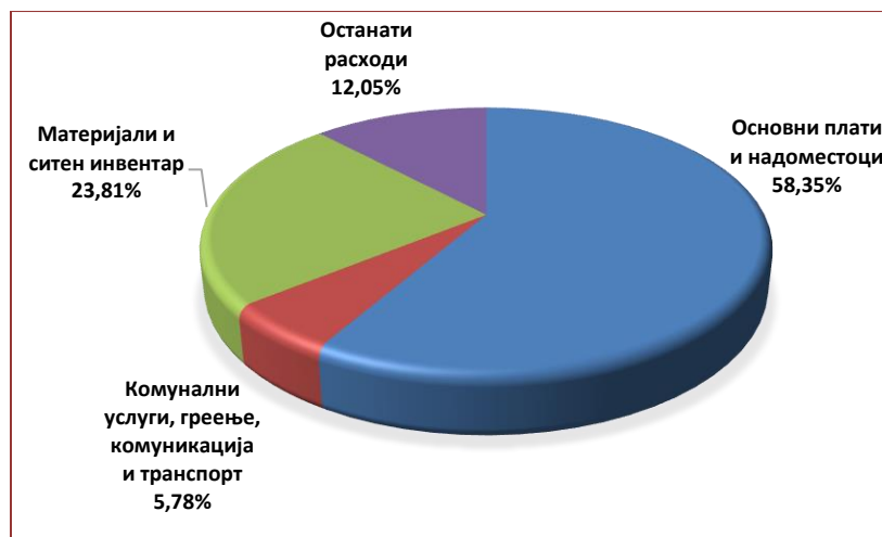
Графички приказ на структурата на реализирани расходи на ЈЗУ во период 01.01-31.01.2022 година