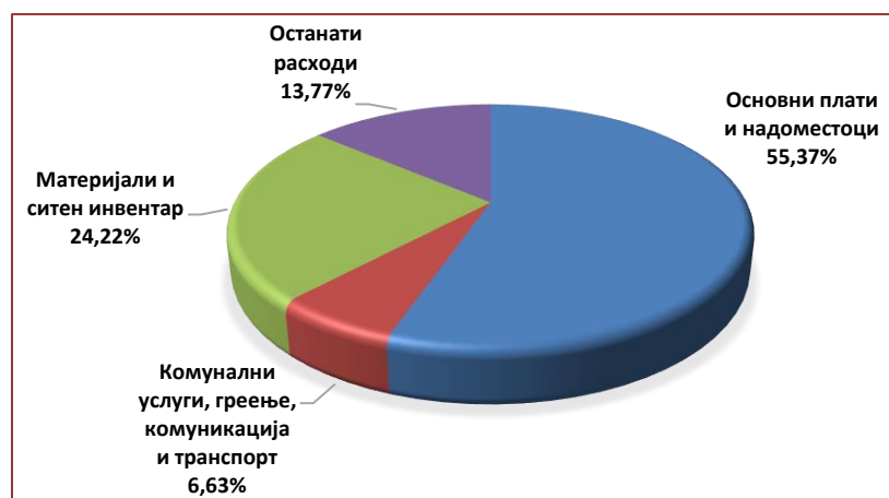
Графички приказ на структурата на реализирани расходи на ЈЗУ во период 01.01-30.04.2022 година