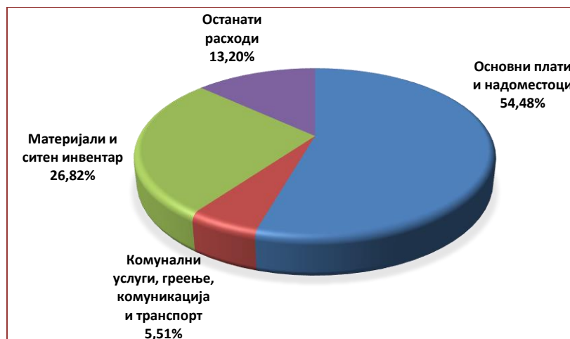
Графички приказ на структурата на реализирани расходи на ЈЗУ во период 01.01-31.01.2023 година